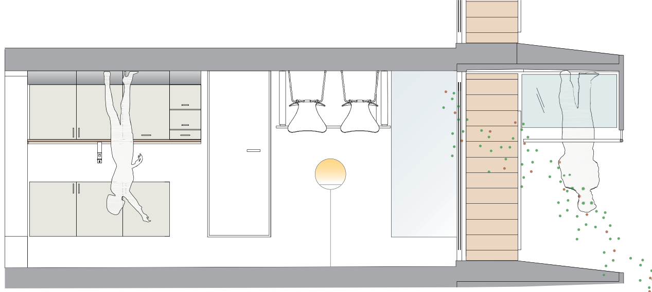
Nyt forslag - snit, mål 1:50

Begge forslag kan ses til sammenligning på folderens næste opslag.